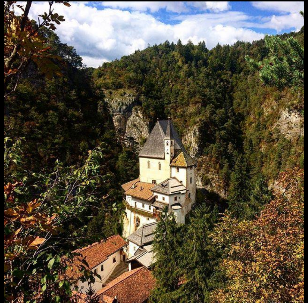
Santuario di San Romedio