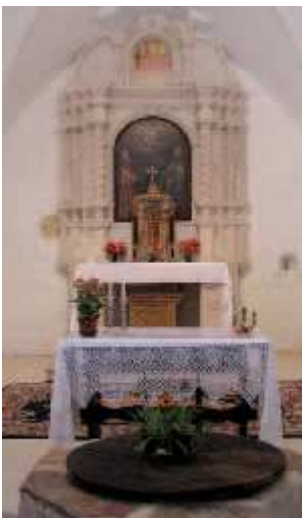
S. Biagio di Romallo, cappella principale con pozzo

Da Casez ci si dirige, attraverso la strada provinciale al Museo Retico , recentemente inaugurato, con ricca esposizione di reperti archeologici che illustrano la preistoria e la storia delle antiche genti d'Anaunia, dei Reti in particolare, fino alla romanizzazione ed alla cristianizzazione ad opera dei missionari poi martirizzati nel 397 d.C. Di fronte al Museo parte l'ardito percorso, in gran parte a strapiombo lungo la forra del Rio San Romedio, che conduce in meno di un'ora al Santuario.