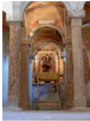
S. Biagio di Romallo: cappella laterale a tre navate