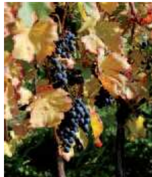
"Groppello" di Revò